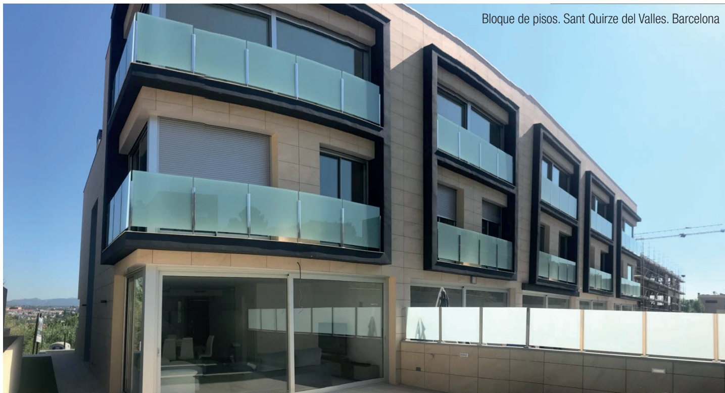
Bloque de pisos. Sant Quirze del Valles. Barcelona