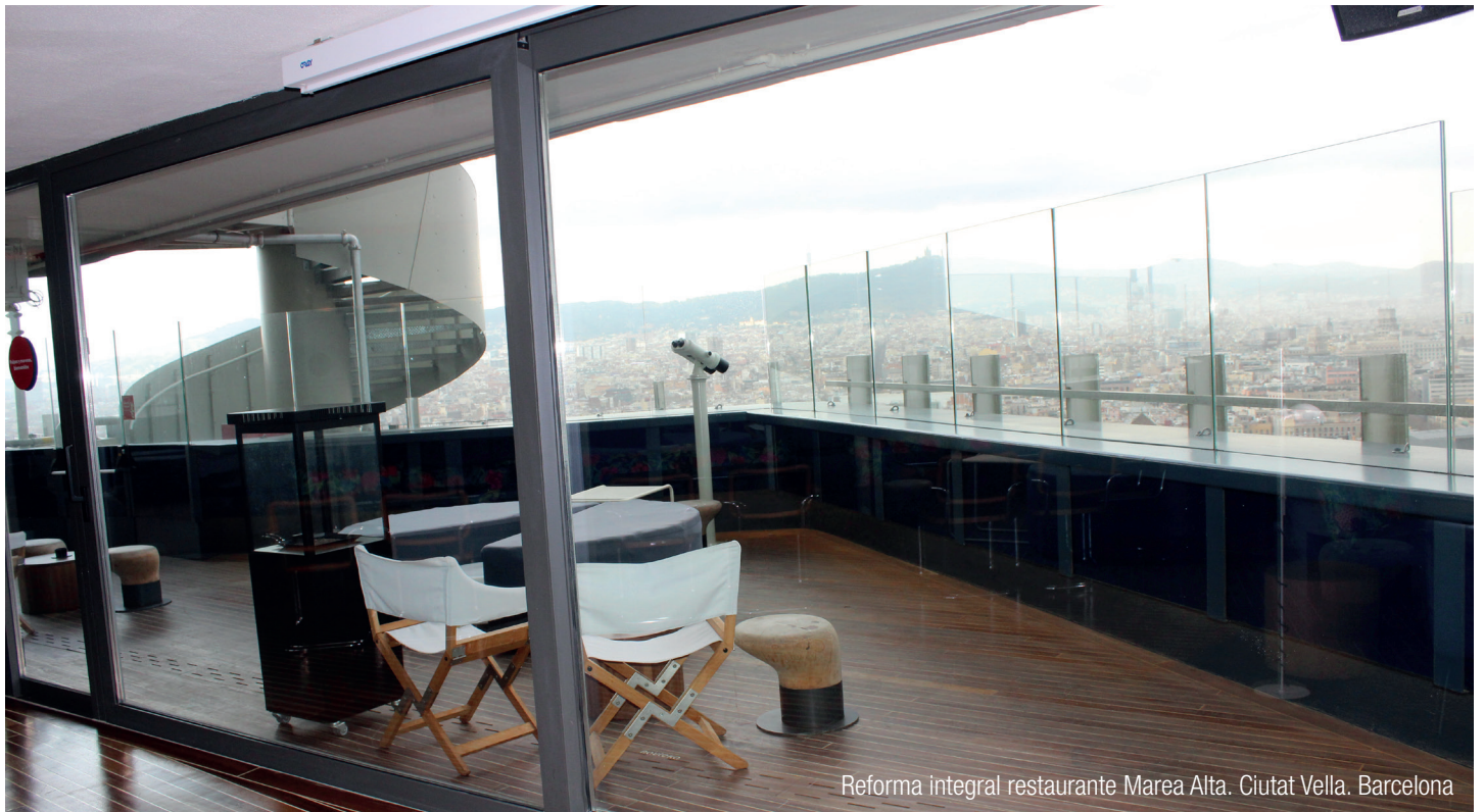
Reforma integral restaurante Marea Alta. Ciutat Vella. Barcelona