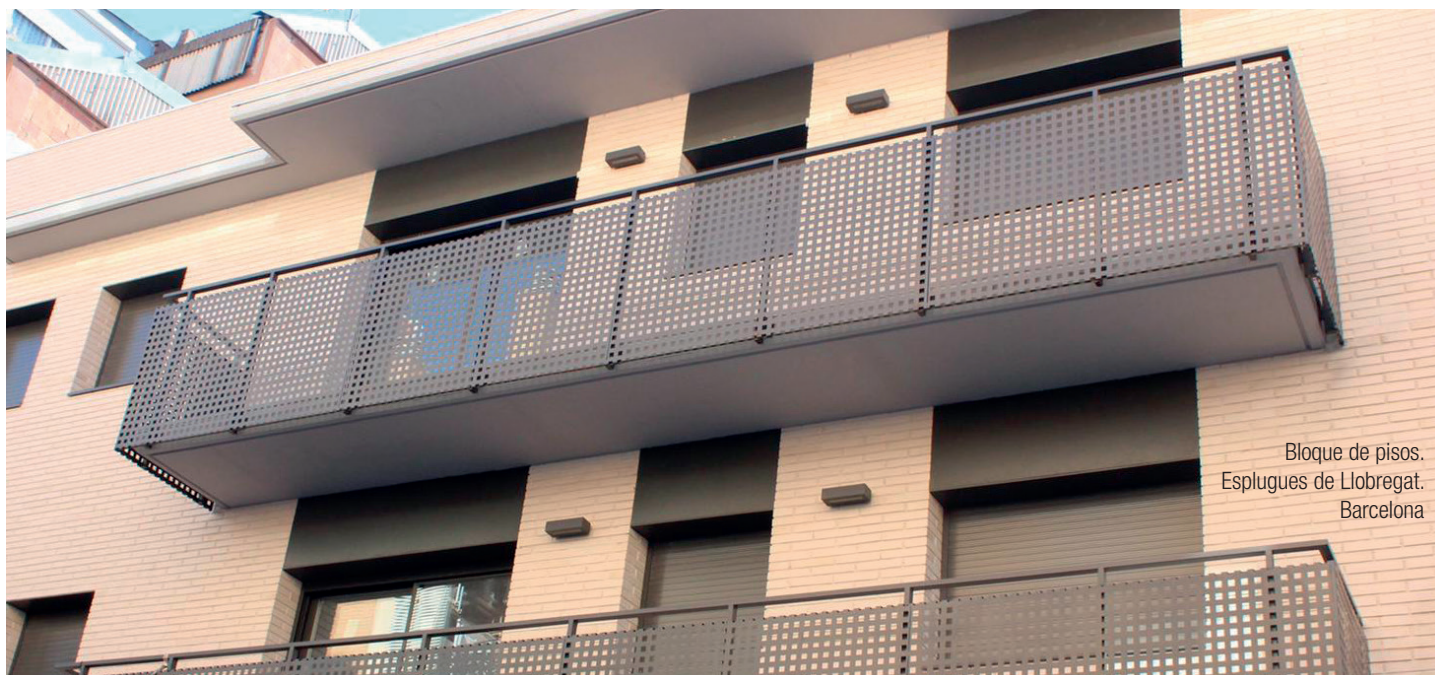
Bloque de pisos. Eslugues de Llobregat. Barcelona